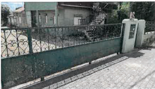
Vista da parcela