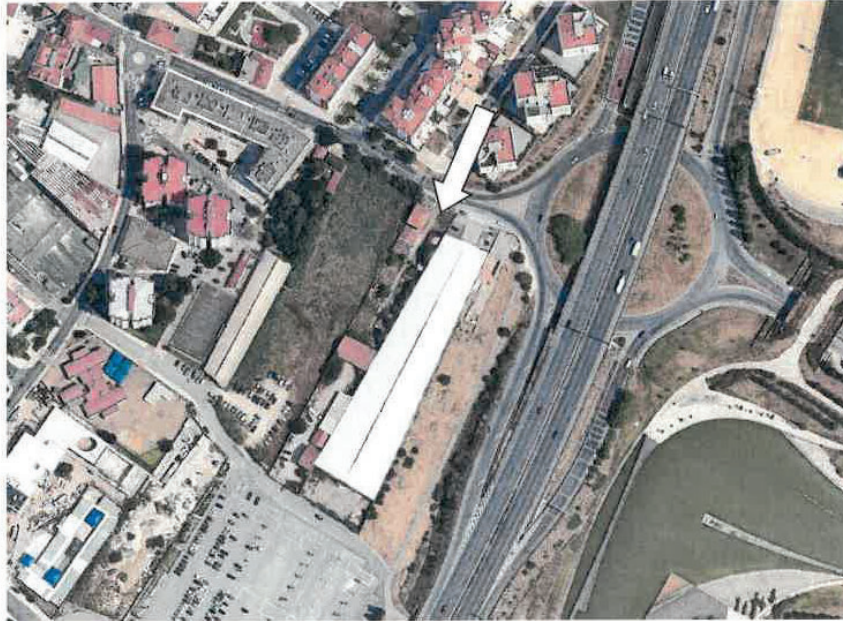
Imagem 2 – Fotografia aérea