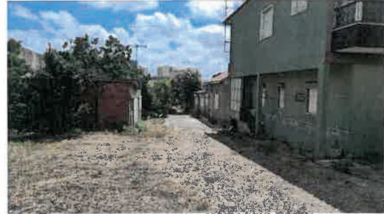
Vista da parcela