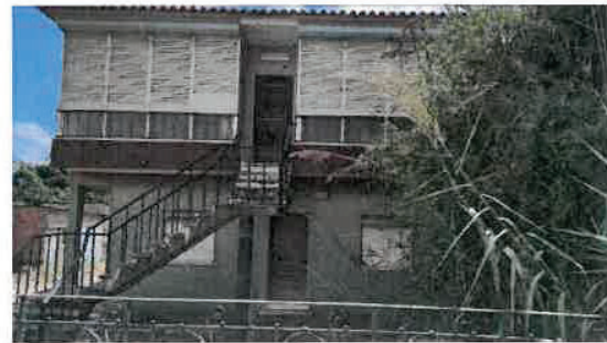
Vista da parcela