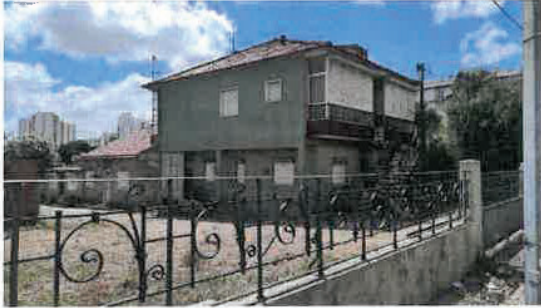
Vista da parcela